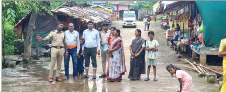
पर्यटकों को सावधानी बरतने समझाती गुरुर पुलिस

बालोद जिले का प्रसिद्ध धार्मिक और दर्शनीय पर्यटन स्थल के रूप में विख्यात है सियादेही मंदिर और उसका झरना। जहां बरसात में हजारों पर्यटक रोज माता के दर्शन और झरना का दीदार करने के लिए आते हैं। बारिश में झरने का मनोरम दृश्य लोगों को आकर्षित करता है, पर इस आकर्षण के साथ-साथ थोड़ी सी लापरवाही जान पर भी भारी पड़ सकती है। ऐसा ही कुछ हादसा रविवार को हुआ था, जब मंदिर घूम कर मुख्य सड़क पर आने के दौरान रपटा पार करते दो युवक बह गए थे। समय रहते मौजूद लोगों की नजर पड़ी और कुछ मिनट बाद बह रहे युवकों को बचा लिया गया। पर यह हादसा और भी किसी के साथ और कोई भी दिन हो सकता है। इस घटना के बाद बालोद जिला पुलिस अलर्ट मोड पर आ गई है। घटना के बाद सवाल उठ रहा था कि जिला प्रशासन और पुलिस प्रशासन द्वारा सुरक्षा व्यवस्था को लेकर कोई इंतजाम नहीं किए जाते हैं। दोनों युवकों के बहे जाने की घटना सुर्खियों में रही। जिसके बाद अब गुरुर पुलिस अलर्ट मोड पर आ गई है। मौके की परिस्थितियों को जानने के लिए जब हम भी सियादेही