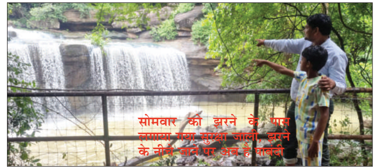
सोमवार को झरने के पास लगाया गया सुरक्षा जाली, झरने के नीचे जाने पर अब है पाबंदी

ओर जाने वाले मार्ग पर एक कैमरा भी लगा हुआ था लेकिन वह बंद पड़ा हुआ था। जिसकी जानकारी मिलने पर थाना प्रभारी द्वारा उसे तत्काल सुधरवाया गया ताकि झरने की ओर आ जा रहे लोगों की निगरानी हो सके। इसी तरह अन्य जगहों पर भी कैमरे लगाए गए हैं। पुलिस प्रशासन