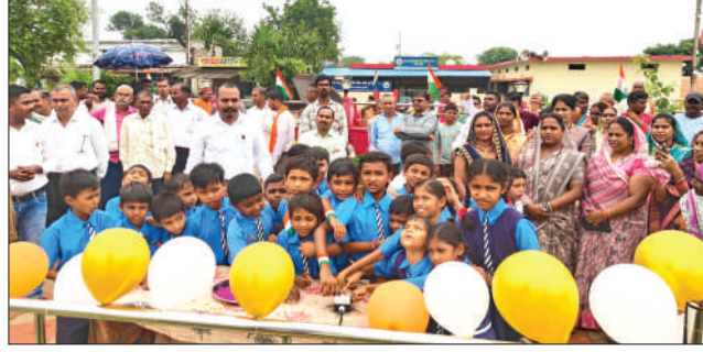
डीबी डिजिटल मीडिया बालोद

बालोद जिले के गुंडरदेही ब्लॉक के अंतर्गत आने वाले ग्राम पंचायत कुरदी में इस बार स्वतंत्रता दिवस खास तरीके से मनाया गया। जहां गांव के विभिन्न चौक चौराहों पर ध्वजारोहण तो हुआ ही, वीर सपूत उद्यान में ग्रामीणों ने मिलकर सामूहिक रूप से ध्वजारोहण किया। यहां विद्युत तकनीक से ध्वजारोहण किया गया। बता दें कि इस उद्यान में