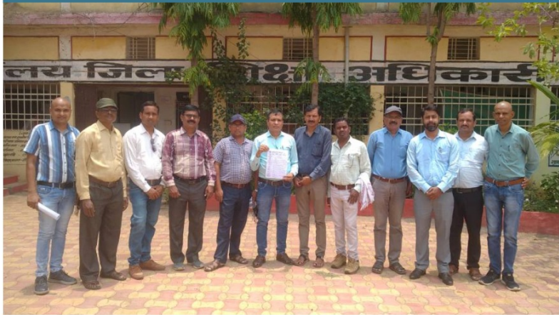
जिला व विकासखंड स्तर पर परामर्श दायी समिति की बैठक भी जल्द होगी