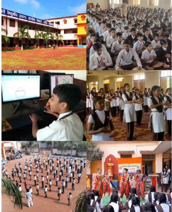
सरस्वती शिशु मंदिर बालोद की विभिन्न गतिविधियाँ दिखाती तस्वीरें

प्रवेश और अधिक जानकारी के लिए इनसे संपर्क करें: 9407937466 (विद्यालय), 8982020966 (व्यवस्थापक), 9425554511 (कोषाध्यक्ष) Email- ssm.balod@gmail.com